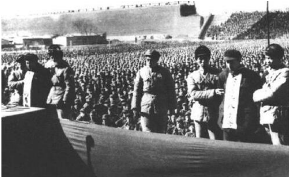
▲1952年2月10日，在保定市体育场召开的“河北省人民公审大贪污犯刘青山、张子善大会”现场。

1952年2月10日，河北省举行对刘青山、张子善的公判大会。经最高人民法院核准，刘青山、张子善被执行死刑。